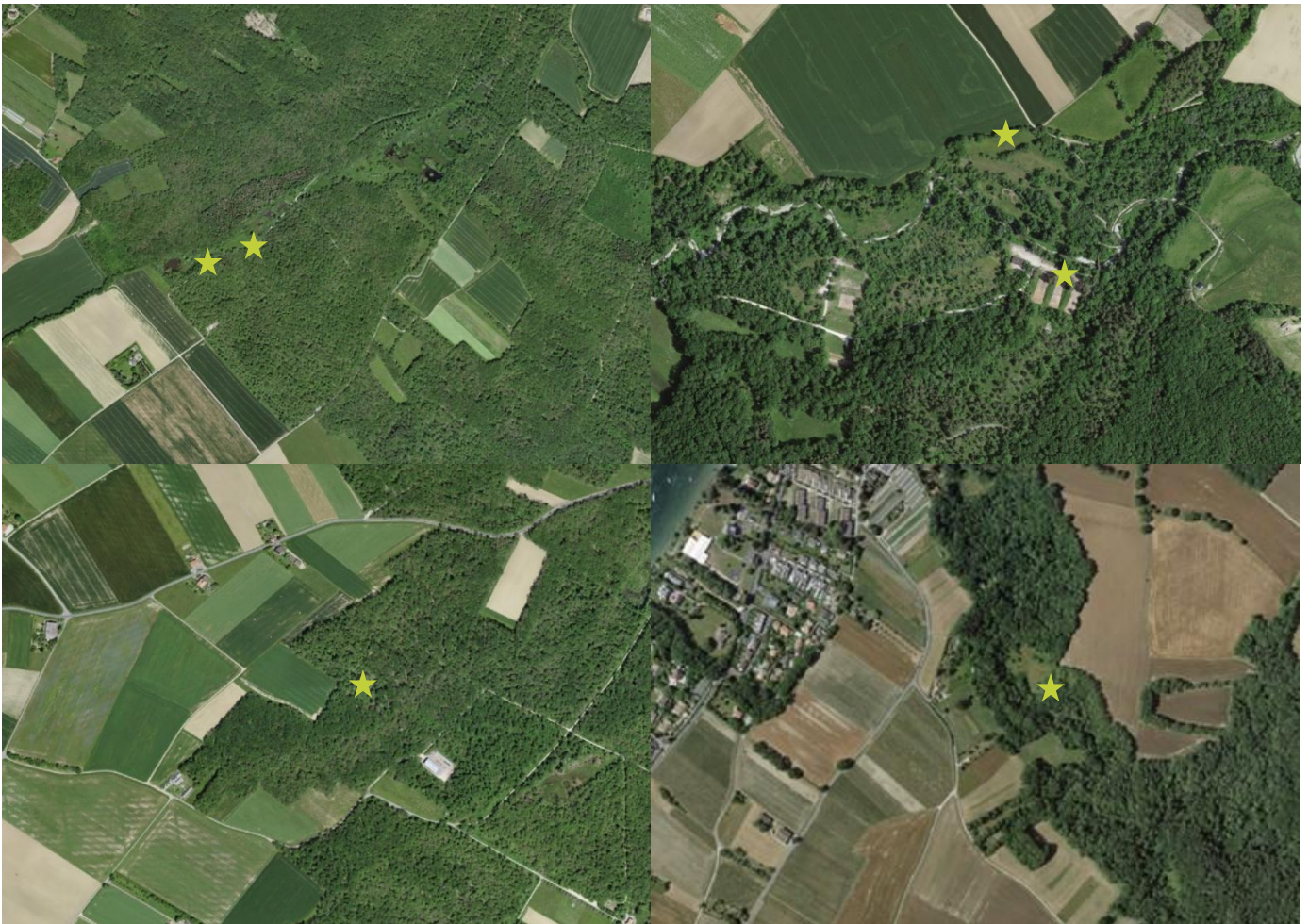
Figure 4. Stations connues pour O. pruni de gauche à droite et de haut en bas : Étang du Prés Bordon (Gy), Raclerets, abords de la Laire (Chancy), Les Feuilletts (Jussy), Espace naturel sensible des Bourgues (Chens-sur-Léman, France, à 50 m d'Hermance).