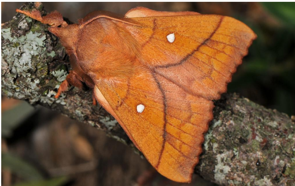
Figure 1. O. pruni ; imago mâle en position de repos, ailes repliées. Abruzzes, Italie, juin 2015.

Entre 40 et 55 mm d'envergure, femelles en moyenne plus grandes et plus foncées. Adulte aux ailes antérieures jaunes orangées, avec des motifs brunâtres ou rougeâtres et une marge externe dentelée typique pour la famille (Fig. 1). Une tache orbiculaire blanche