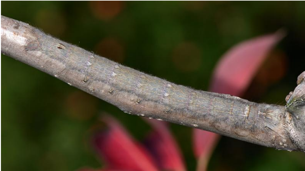
Figure 2. O. pruni ; chenille de stade avancé ; la tête est à droite. Tchéquie, novembre 2016.

Les larves sont observables sur les plantes-hôtes mais bien camouflées. Les jeunes stades sont sombres avec une grosse tête et une bande gris-orangé sur la face dorsale. Une pilosité grise se développe rapidement sur le bas des flancs. Les chenilles de stade plus avancé globalement grises, toujours avec des paires de points clairs sur la partie dorsale de chaque segment, et souvent avec de fines marques orangées sur tout le corps. Une bande transversale, de couleur rouille, traversée de noir et flanquée de points bleus, orne le dos au niveau du deuxième segment thoracique ; visible lorsque la chenille est active, elle est cachée au repos (Fig. 2). De petites marques noires et rouille également présentes dans la partie terminale du dos. Cette combinaison de caractères limite la confusion chez les stades larvaires avancés ; chez les individus peu marqués (d'un gris presque uniforme), les chenilles des genres Gastropacha ou Phyllodesma similaires se distinguent par la présence d'une protubérance dorsale (verruve) dans leur partie postérieure, totalement manquante chez Odonestis .